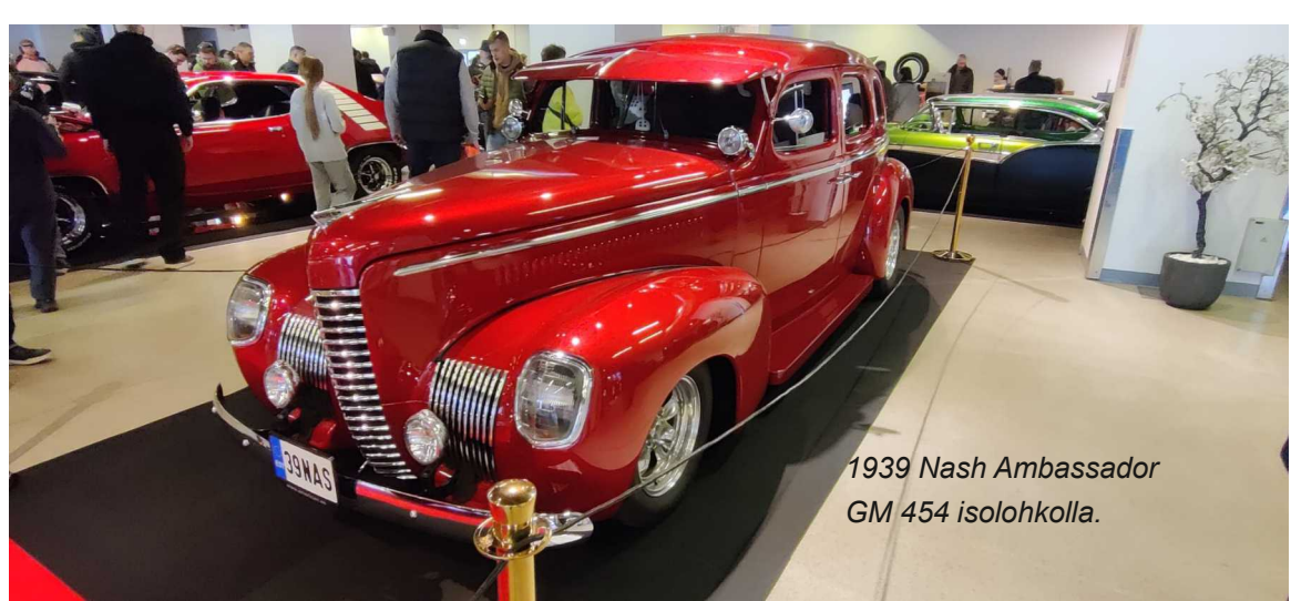
1939 Nash Ambassador GM 454 isolahkolla.

Leather Heaven ja Saluuna Moottoritorstai Moottorikansan kokoontuminen, letkeää ja leppoisa meiniä.